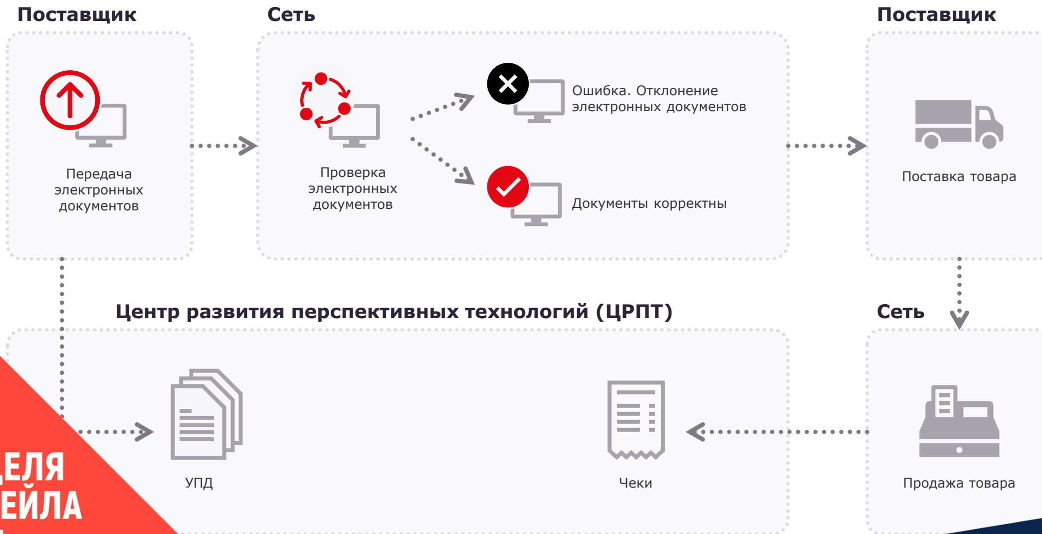
СХЕМА РАБОТЫ ПО ЭЛЕКТРОННОМУ УПД С МАРКИРОВКОЙ